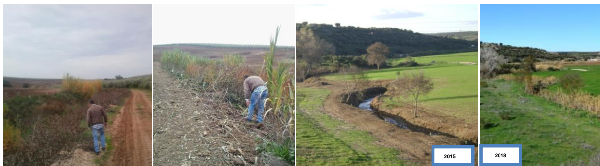
Figura 9. Verificação do estado da vegetação presente

A verificação da eficácia das reabilitações tem como intuito melhorar o processo no futuro, nomeadamente a possibilidade de definir medidas de gestão e reabilitação concretas, que sistematizem recomendações coerentes com as características hidrológicas (regime hidrológico temporário e intermitente, de carácter torrencial (com episódios de inundações e secas), hidromorfológicas (erosão, ravinamento, assoreamento, pressão humana e ocupação cultural) e estruturais (estratos de vegetação, vegetação invasora e grau de conservação) onde se integram estas linhas de água (Vd. figura 9).