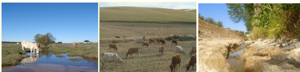
Figura 8. Pastoreio, abeberamento de gado, e situações de erosão e ravinamento