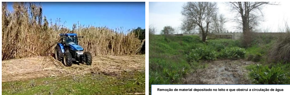
Figura 2. Exemplo de limpeza de vegetação invasora exótica e de uma situação de obstrução

Em termos de metodologia de actuação, esta baseia-se na operacionalização de tipologias de intervenção diversas, sendo que, numa primeira fase as mais comuns são a limpeza de vegetação invasora exótica ( Arundo donax ) e indígena ( Rubus ulmifolius , em situações de comportamento invasor) e a desobstrução nas situações em que vegetação dificulta ou impede o acesso à água e interfere com o escoamento eficiente da água (Vd. figura 2).