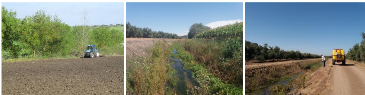
Figura 7. Mobilização e ocupação e cultural até ao limite da crista do talude, e aplicação de herbicida

Como exemplo destas pressões que se têm vindo a verificar junto a linhas de água, destacam-se a mobilização dos terrenos até ao limite da crista do talude; a ocupação cultural até às margens; a aplicação de herbicidas na vegetação, o pastoreio, o abeberamento de gado, e situações de erosão, ravinamento e assoreamento. Como exemplo destas situações exemplificam-se na figura 7 e 8.