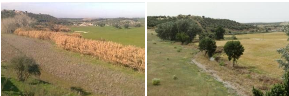
Figura 3. Exemplo de um troço de linhas antes e após a limpeza de vegetação exótica

De salientar que a metodologia de actuação passa, para qualquer das anteriores tipologias mencionadas, pela preservação da vegetação ripícola existente e pela manutenção da estrutura radicular da vegetação arbórea, arbustiva e herbácea, face à sua relevância na estabilidade das margens e taludes prevenindo eventuais fenómenos de erosão hídrica (Vd. 3).