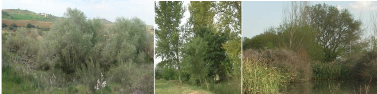
Figura 6. Habitats da Diretiva mais representativos das Linhas de Água

A reabilitação das linhas de água com a plantação de espécies arbóreas, arbustivas e herbáceas, tem por objetivo valorizar as galerias ripícolas, mais concretamente os habitats de água doce típicos (Vd. figura 6) destas linhas de água (com áreas de bacia hidrográfica inferior a 100 km 2 ).