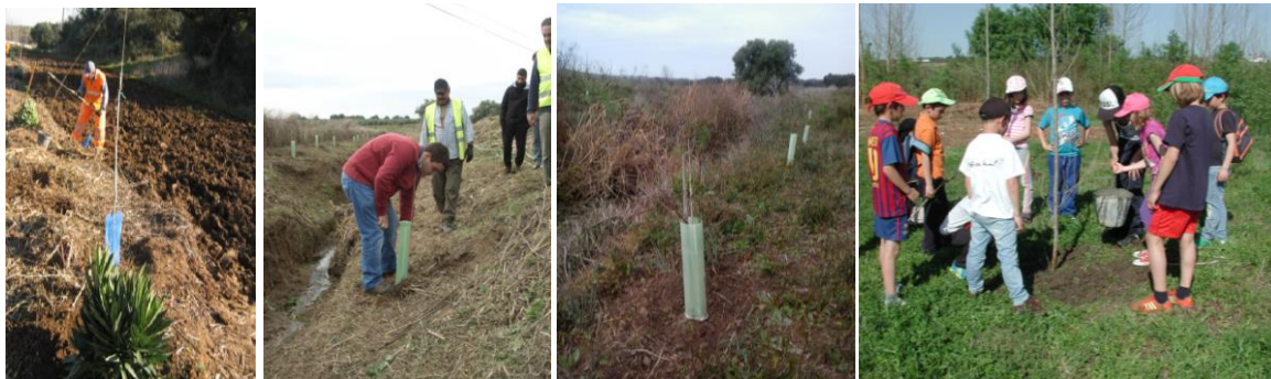
Figura 4. Plantação de exemplares ripícolas

As plantas utilizadas nesta tipologia de intervenção compreendem exemplares arbóreos e arbustivos autóctones, como é o caso de freixos ( Fraxinus angustifolia ), choupos ( Populus alba ), salgueiro ( Salix atrocinerea e Salix salvifolia ), amieiros ( Alnus glutinosa ), ulmeiros ( Ulmus minor ), bem como loendros ( Nerium oleander ), aroeira ( Pistacea lentiscus ), catapereiro ( Pirus piraster ), pilriteiro ( Crataegus monogyna ), tamujo ( Securinega tinctoria ) e tamargueira ( Tamarix africana ). No âmbito da reabilitação têm-se desenvolvido ações de carácter pedagógico, tal como se ilustra na figura 4.