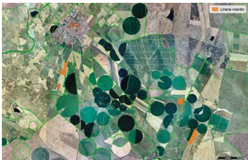
Figura 1 – Localização das áreas onde ocorre a espécie Linaria ricardoi